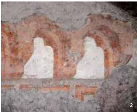
Abb. 1 und 2: Figurennischen bzw. Fenster­nischen mit Schriftband in gotischen Minuskeln überschrieben mit gotischen Majuskeln.

In einem Kellerraum des Grazer Franziskanerklosters befinden sich Wandmalereien, die zu den ältesten Fresken von Graz zählen. Lange Zeit blieben sie unbeachtet. Staub und Feuchtigkeit haben jetzt eine dringende Restaurierungskampagne erfordert. Es musste rasch gehandelt werden. Restaurator Mag. Claudio Bizzarri hat in sensibler Weise die Fresken gereinigt und gesichert.