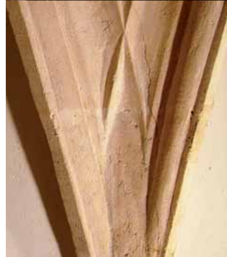
Bild oben: Heutiges Sitzungszimmer im Obergeschoss der Kammerkapelle Bild unten: Detail des Gewölbeansatzes