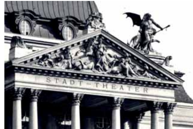
Bild oben, Abb. 4: Postkarte Graz Opernhaus, Detail des Portikus, Hauptgiebel mit der „Bacchantengruppe“ im Hintergrund, Foto F. Gratl, o. J.

Das neoklassizistische Figurenprogramm wurde, wie der gesamte Portikus, aus Afzener-Stein gefertigt. Die Mitte des Hauptgiebels (Abb. 4) schmückte Pegasus mit einer Muse, flankiert von den allegorischen Figurenpaaren „Drama“ und „Lustspiel“. 7 Die Allegorie „Drama“ zeigte eine am Rücken liegende weibliche Figur, die unter dem aufsteigenden geflügelten Musenross tragisch zu Sturz gekommen ist, sowie eine kniende männliche Figur seitlich davon. Ein Liebespaar, das auf einem Löwen ruht, stellte die Allegorie „Lustspiel“ dar. Putti füllten die Giebelzwinkel und hielten am Giebelfirst eine Lyra über einem Wappen mit dem steirischen Panther empor. Palmettenakrotere an den seitlichen Giebelcken vervollständigten den Giebelschmuck.