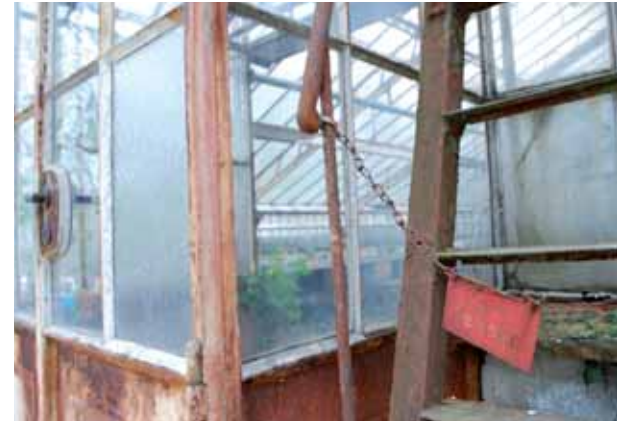
Bild oben: Wegen der Gefahr herabfallender Gläser ist der Zutritt verboten

Bild links: Gewächshaus, Ansicht von Südwesten