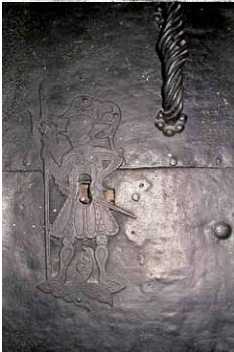
Bild oben: Südansicht der Grazer Burg von Andreas Trost um 1700 Bild unten: Detail der eisenbeschlagenen Türe zur ehemaligen Burgkapelle

Nunmehr ist beabsichtigt, diesem gotische Baujuwel durch Entfernung der störenden Zwischendecke wieder seine ursprüngliche Raumwirkung zu verleihen. Schon im Jahre 2008 beschloss der Landtag durch Entfernung der Zwischendecke die Kapelle wieder ihrer ursprünglichen Funktion zuzuführen. Das Projekt ist bereits ausgearbeitet.