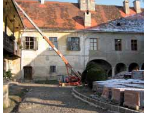
Bild oben: Sanierter Ostflügel Bild Mitte: Tag der offenen Türe Bild unten: Sicherung und Öffnung der Ostflügelarkade