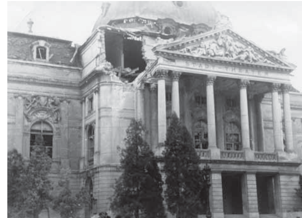
Bild oben, Abb. 2: Foto von dem Bombenschaden an der Grazer Oper, 1944

Das große Unglück der Zerstörung begann im Zweiten Weltkrieg. Bei einem Bombenangriff am 1. November 1944 erhielt die Hauptfassade einen Volltreffer, der ein großes Loch in die Ecke des Mittelrisalits schlug und dessen Kuppel schwer beschädigte (Abb. 2). Zwar blieb der Portikus selbst weitgehend unversehrt, doch wurden die Giebelskulpturen teilweise zerstört. Nach den verheerenden Kriegsschäden war an eine Instandsetzung des Bombenschadens der Oper aufgrund mangelnder Arbeitskräfte, Materialknappheit und fehlender Zahlungsmittel in der Folgezeit nicht zu denken. So klaffte bis Februar 1946 ein großes Loch in der Hauptfassade, als ein weiteres Ereignis die Bausubstanz des Gebäudes zusätzlich massiv bedrohte. Vom 18. bis zum 19. Februar 1946 rissen heftige Sturmböen 1 die Dachverkleidung der bombengeschädigten Kuppel los, so dass die Feuerwehr aufgrund drohenden Absturzgefahr Sicherungsarbeiten vornehmen musste. 2 Vermutlich war dieses Sturmereignis Auslöser für die darauf folgenden Maßnahmen zur Beseitigung des Bombenschadens,