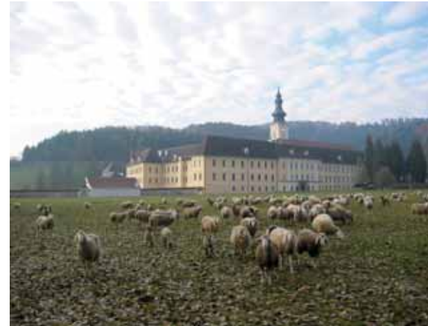
Bild oben: Das Stift Rein in der für Zisterzienserklöster typischen Landschaft

In den großen Restaurierungsvorhaben des Stiftes nicht erfasst, jedoch auch unbedingt erhaltenswert, sind die bis dato in der Öffentlichkeit wenig bekannten, und daher auch kaum beachteten, spätgotischen Wandmalereien in einem Raum des Reiner Stiftsarchivs.